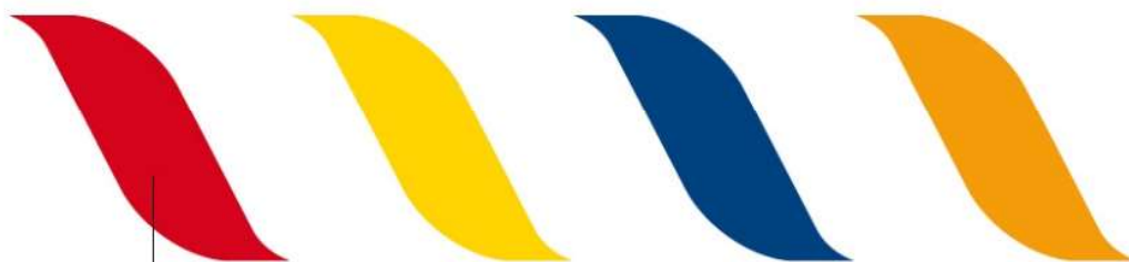
• Primaire kleuren