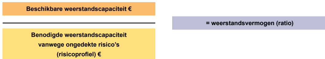
Figuur 1: Berekening ratio weerstandsvermogen

De benodigde weerstandscapaciteit is € 2.572.500 en de beschikbare weerstandscapaciteit is € 2.400.000. Het weerstandsvermogen komt dan uit op 0,93. Volgens de kwalificatie van het Nederlands Adviesbureau is de omvang van het weerstandsvermogen in relatie tot geïdentificeerde risico's daarmee matig (boven de 1 is voldoende).